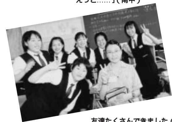
友達たくさんできました(白石中)