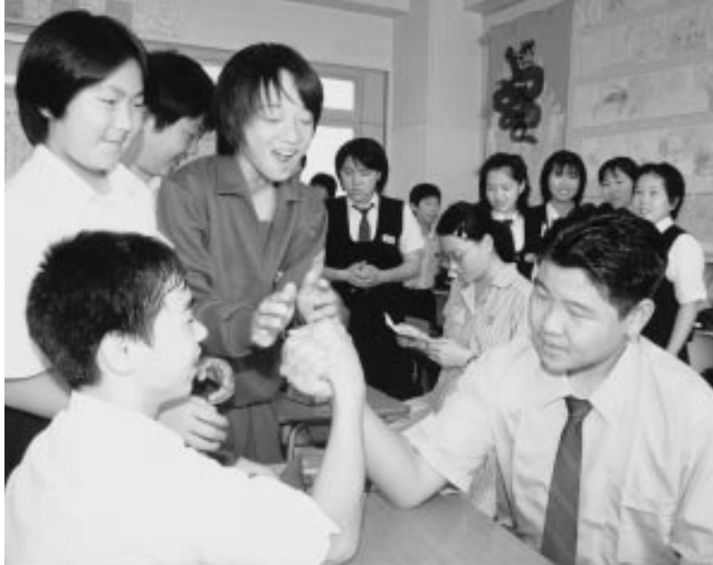
◀給食時間も和やかに(白石中)