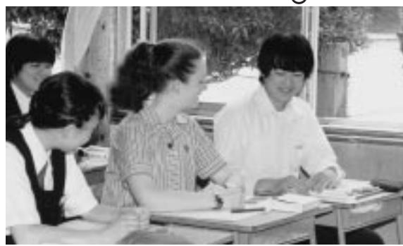
「What are your hobbies? (趣味は何ですか?)」 「えっと……」(南中)