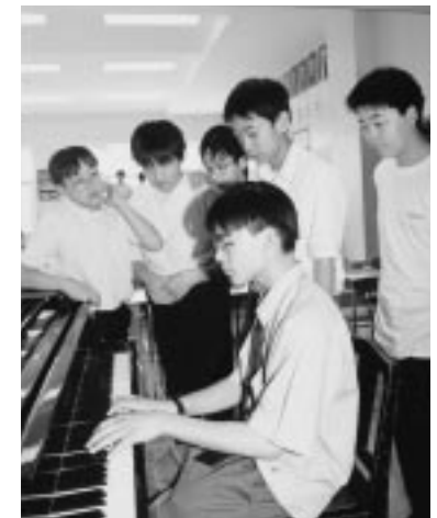
音楽の授業を前に 得意のピアノを披露(東中)