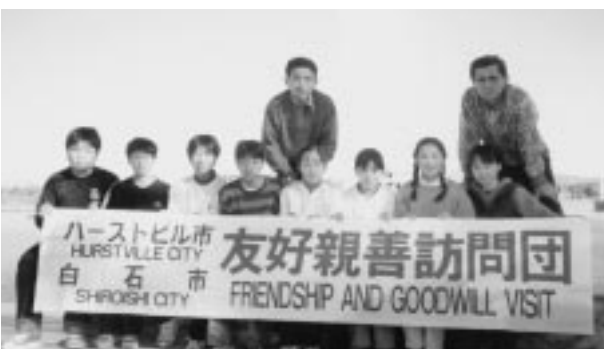
昨年ハーストビル市を訪れた白石の中学生たち

これまでのハーストビル市と の交流に参加された人たちは、 ライフスタイルや考え方など異 文化の中に立たされて、改めて 「自分」を見直すことができました のではないのでしょうか。 今後は、その貴重な体験を生 かし、いろいろなことにチャレ ンジしてほしいと思います。そ して、この交流で得たことを多 くの友達や後輩に伝えてくださ い。将来の白石を担う青少年の ために。