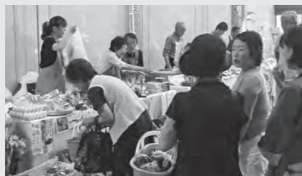
▲昨年の県庁1階展示販売会の様子

9月15日(日)の「第27回しろいし蔵王高原マラソン大会」(場所:南蔵王野営場)にも出店予定です。