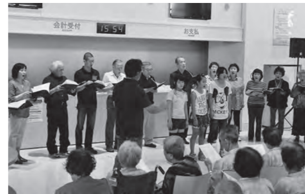
▲きれいな歌声を披露する合唱団の皆さん

8月7日、「第42回ロビーコンサート」が公立刈田総合病院で開催されました。この日は、キューブ合唱団の団員21人が、入院患者やその家族など約60人の前で、「花は咲く」「ふるさと」など8曲を合唱。来場者は、団員たちの歌声に合わせて、歌詞を口ずさんだり、手拍子を打ったりするなど、楽しいひとときを過ごしていました。同病院では、音楽が病気を治す手助けをしてくれると考え、ロビーコンサートを開催しています。演奏や歌声を披露していただける方は、情報企画課(☎25-2145)までお問い合わせください。