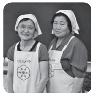
ヘルスマイト白石 齋川地区の皆さん

①作り方 ①ひじきは軽く洗い、水で戻し、戻ったら水気を切っておく。ニンジンも千切りにする。 ②鍋に分量の水を加え、ニンジンとひじきを入れ、蓋をして弱火にかけ、ニンジンがやわらかくなるまで蒸す。 ③(A)の合わせ調味料に軽く絞った②を入れて和え、器に盛る。