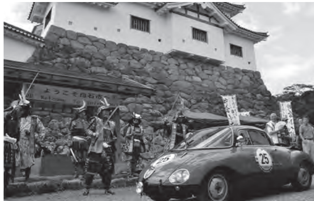
▲甲冑工房片倉塾の皆さんも駆け付け参加者をお出迎えしました

7月14日、チェックポイントの白石城では、往年の名車を見ようと駆け付けた多くの市民などが、通過する車に大きな声援を送っていました。