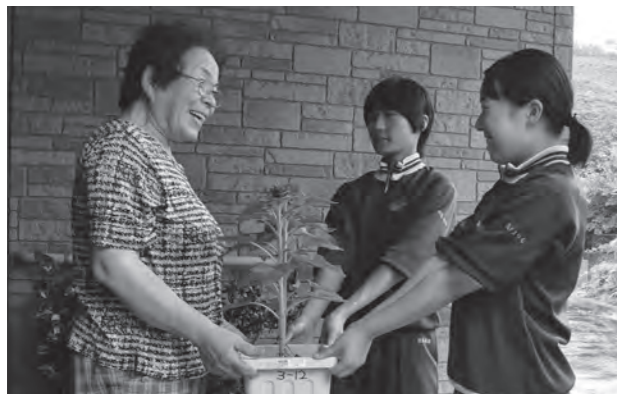
▲ヒマワリをプレゼントし、笑顔の花を咲かせる生徒たち

7月25日、白石南中学校2～3年生約40人が日ごろからお世話になっている地域の人たちに、感謝の気持ちを伝えようと、学校周辺の越河・斎川地区の一人暮らしの高齢者宅などを回り、ヒマワリのプランターをプレゼントしました。生徒たちは、「いつも見守ってくれてありがとうございます」などと声を掛け、プランターをプレゼント。受け取った地域の方は、「地域のことを考えてくれてとてもうれしい。大きな花が咲いてほしいです」と笑顔で話していました。26日には1年生15人も高齢者宅などを回り、地域の人たちと交流を深めていました。