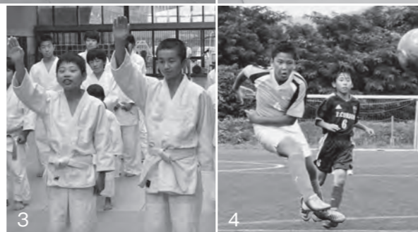
1～3_登別市とのスポーツ交流。本市の選手たちが登別市を訪れ、柔道で対戦した。 4_海老名市とのスポーツ交流。海老名市の選手たちが本市を訪れ、サッカーで対戦した。

猛暑の中行われたそれぞれの大会。選手たちは暑さに負けず、スポーツを通じて友情を深めていました。