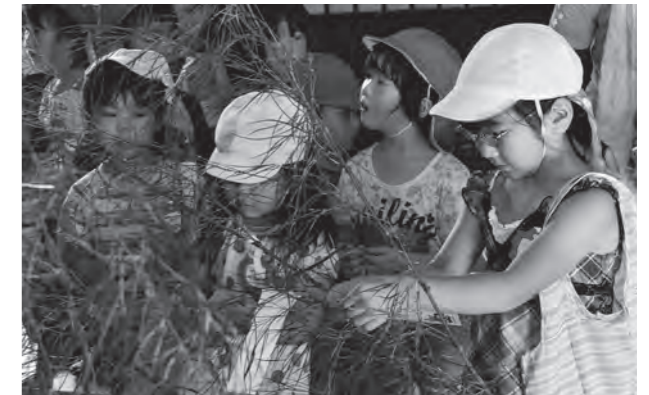
▲願いを込めた短冊を飾り付ける園児たち

8月6日から8日の3日間、七夕まつりが武家屋敷で開催されました。この催しは、地元の伝統文化を後世に伝えようと、公益財団法人白石市文化体育振興財団が企画。7日は、西保育園の4～5歳児約30人が訪れ、「ゴバスターになりたい」「けいさつかんになりたい」など、さまざまな願いごとを書いた短冊をササの葉に飾り付けました。飾り付けた後は、園児たちにかき氷が振る舞われ、園児たちは、「あまくておいしい」とうれしそうにほおぼっていました。期間中は園児たちのほか、多くの家族連れなどが七夕の星に願いを託していました。