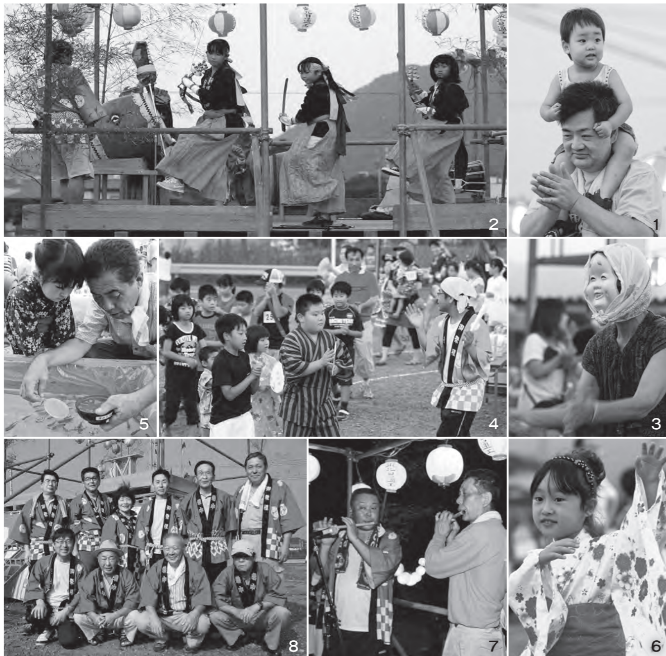
1・3・4・6 思い思いの服装でまつりを楽しむ参加者。中には子どもを肩車して踊るほほえましい参加者も！ 2_「深谷神明神楽」を披露する深谷小学校の児童たち。「深谷神明神楽保存会」の指導を受け、踊りに込められた願いや思いを受け継いでいる 5_金魚すくいは子どもたちに大人気！ 7_笛や太鼓が奏でる音色、なじみの唄が流れ出せば心も体も踊り出す 8_各地区から総勢約60人の実行委員がまつりの準備や片付けに当たり、参加者に笑顔と元気を届けた

「みんなで何かをすること」で、地域が元気になるのではないかと思います。これからも深谷地区の夏の恒例イベントとして、このまつりが地域の人たちの集う場になればとてもうれしいです。