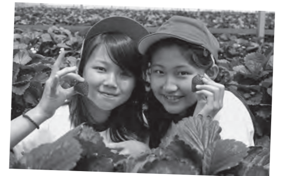
山元町のイチゴは、甘くておいしいよ!