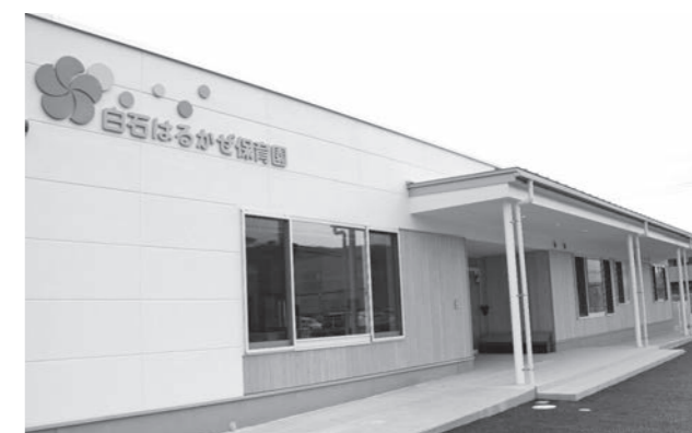
▲東保育園に代わってこの春開園した「白石はるかぜ保育園」(東町)