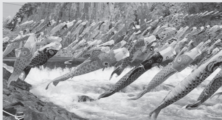
▲白石川上空を泳ぐこいのぼり

●販売日時 4月～11月 10:00～15:00 ●場 所 小原材木岩公園内 ☎小原いきいき直売所 ☎29-2760