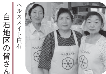
ヘルスメイト白石 白石地区の皆さん

③鍋に①を入れて火に掛 け、沸きたら火を止め、 ①と②を加えて20〜30分 漬けたら出来上がり。