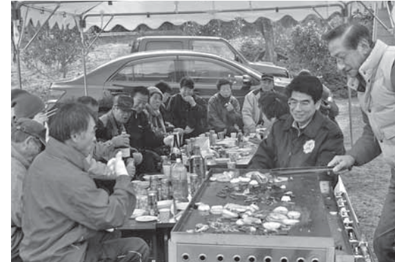
▲これからの活動について語り合う自治会の皆さん