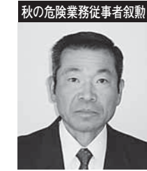
秋の危険業務従事者叙勲

昭和22年7月に旧国鉄仙台鉄道管理局長町機関区に勤務されて以来、39年の永きにわたり奉職されました。この間、仙台建築区助役、福島建築区長、仙台建築区長などの要職を歴任し、鉄道事業の発展にご尽力されました。