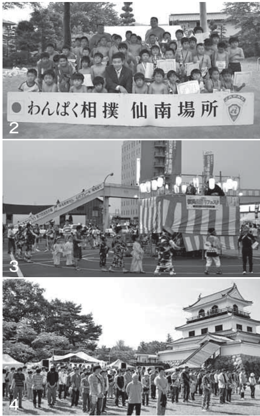
1_40周年記念事業として開催した「渡部陽一氏講演会」。講演後、渡部陽一さんを囲んでの記念撮影 2_昨年で第16回を数えた「わんぱく相撲仙南場所」 3_平成22年に13年ぶりに復活させた「白石駅前盆踊り」 4_被災者への鎮魂を込めて開催した「東日本大震災チャリティーコンサート」

・住所 白石市字本鍛冶小路13 ・電話 0224-24-4555 (平日の12:30～15:30) ・ホームページURL http://www.shiroishi-jc.com