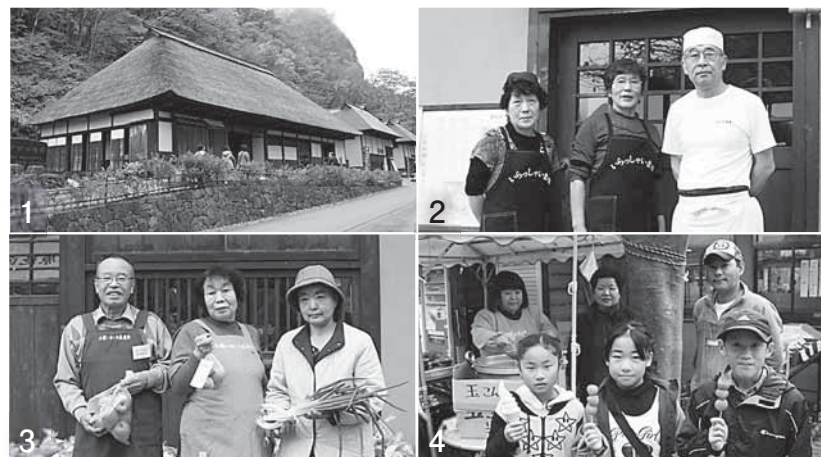
1_自然景観の素晴らしさと歴史ロマン漂う材木岩公園。「検断屋敷」は12月～2月まで休業し3月から再開。その他の施設は3月まで休業し4月から再開 2_小原産そば粉を使用した自慢のそばを提供する「そば処なごみ茶屋」の皆さん 3_小原でとれた季節の農林産物などを提供する「小原いきいき直売所」の皆さん 4_公園にある売店はソフトクリームや玉こんにゃく、焼きだんごが大人気!

東日本大震災以後、福島第一原子力発電所の事故による風評被害などで観光客は例年の半数となっていますが、私たちの地域おこしにける気持ちに変わりはありません。これからも地域の人たちとともにまつりを開催し、この場所から小原の元気を発信していきたいと思ひます。