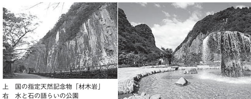
上 国の指定天然記念物「材木岩」 右 水と石の語らいの公園

子どもからお年寄りまでがつながりを持てるという意味で検断屋敷まつりは重要なイベント。これからも小原ならではの生活文化などを大切に受け継いでいくためにも、世代を超えたつながりを深め、小原の魅力を伝えていきたいと思ひます。