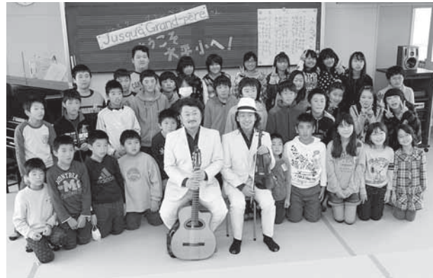
▲授業の最後に笑顔で記念撮影（11月13日、大平小学校）

11月13日と15日、映画やCM音楽なども手掛けるインストゥルメンタル・アコースティック・デュオ「ジュスカ・グランパール」の2人が市内4つの小学校を訪れ、「音楽アウトリーチ」を開催しました。この催しは、芸術を身近に感じられる地域づくりに寄与したいと、(財)白石市文化体育振興財団とみやぎ県民文化創造の祭典実行委員会が主催。児童たちは、ギターとバイオリンから流れる、情熱的で美しいメロディーを堪能し、最後は、2人の演奏に合わせて「ふるさと」を歌うなど、音楽を身近に感じる、貴重な経験となりました。