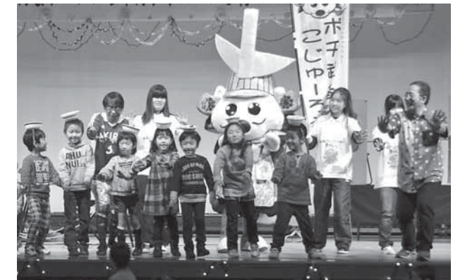
▲ステージで「白石うーめん体操」を踊る参加者

12月2日、「あきらちゃん&ラーメンちゃん～クリスマス子育てふれあいコンサート」を中央公民館で開催しました。この日は約250人の親子が会場に詰め掛け、クリスマスにちなみ遊び歌やダンスなどを行い、子どもも大人も笑顔いっぱい時間を過ごしました。コンサートの終盤には、市内幼稚園・保育園の先生たちも作詞や振り付けなどの制作に参加した「白石うーめん体操」をみんなで元気にダンス！ 手作りの井を準備して踊る子どもたちを見つけると、「この曲が白石で根付いてくれるのがとてもうれしい」と2人は話していました。