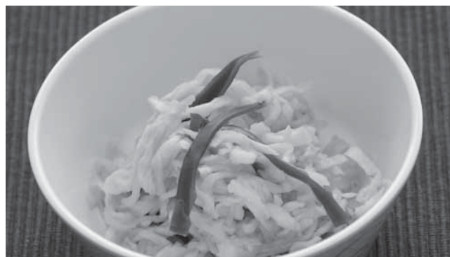
エネルギー 57kcal、たんぱく質 1.5g、塩分 1.1g

① 作り方 切り干し大根は、水の中 でもみ洗いし、水に10分 15分漬けて戻す。戻した ら水気をよくしぼり、4 5cmの長さに切る。 ② コンブは長さ3〜4cmの