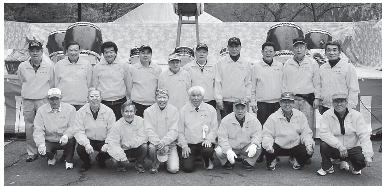
▲春・夏・秋・冬と年4回開催されるまつりには小原地区のすべての自治会長や元自治会長、小原温泉旅館組合長、農家組合委員の代表者などが実行委員として参加。小原を盛り上げる仕掛けが詰まった風物詩「検断屋敷まつり」は楽しいがいっぱい!