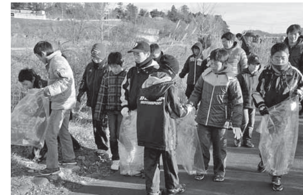
▲厳しい寒さの中でも、笑顔で公園をきれいにしました

12月2日、「第22回スポーツ少年団奉仕活動」が白石川緑地公園で行われました。この活動は、環境美化に取り組むことで公共心と郷土愛を育て、子どもたちの健全育成を図ることを目的に、毎年開催されています。今年も、野球やサッカー、空手、剣道、柔道、ソフトテニス、バレーボールなど19団体から団員や保護者、指導者など約390人が参加。参加者は朝8時から約1時間、たばこの吸い殻や空き缶を拾うなど公園内の清掃作業を行いました。子どもたちは、「いつも使っている公園がきれいになるのはうれしい」と笑顔で話していました。