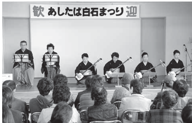
▲500人を超える方々が来場。写真は弥登孝会の皆さんによる長唄

11月18日、あしたば白石で活動するサークルや講座受講生の皆さんが一年の学習の成果を発表する「あしたば白石まつり」が開催されました。38回目を迎えた今年のまつりは、「出会い ふれあい みんなの輪～元気で行こう白石から～」をテーマに開催。写真や絵画、ツールペイントなど自慢の作品展示のほか、舞台ではギターやダンス、コーラス、民謡など17団体が日ごろの練習の成果を披露しました。あしたば白石のサークルや講座を通して出会い、ふれあい、輪を広げていった皆さんからは、大きな元気を感じることができました。