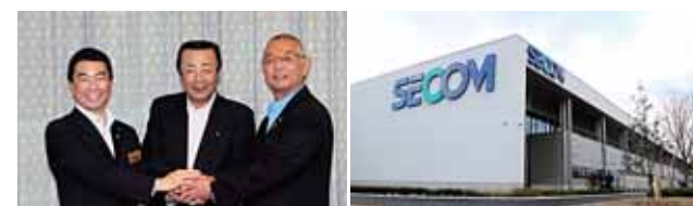
(左)県庁で(株)パルタックと立地協定 (右)セコム工業(株)新社屋