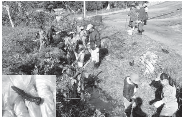
▲一生懸命に生き物を探す児童たち（写真左下は孫太郎虫）

11月9日、斎川小学校3・4年生14人が斎川鹿ノ子沼ため池周辺で生き物調査を行いました。白石市土地改良区では、農業用水や農地の管理という本来の役割に加えて、「21世紀創造運動」として自然環境との調和や農業に触れる体験の場を提供するなど、さまざまな活動を展開しています。この日は、普段、農業用水として使用しているため池などにどのような生き物が住んでいるかを調査。現在はあまり見かけなくなった「孫太郎虫」を発見するなど、身近な場所での新しい発見に児童たちは大興奮！ 古里の宝を知る、貴重な体験となりました。