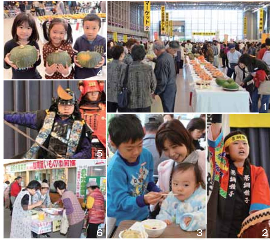
1_大勢の人でにぎわう農業祭会場 2_農業祭のオープニングを飾った大鷹沢子ども太鼓 3_斎川米新米まつりで振る舞われた炊きたての新米 4_秋の恵みに子どもたちもニッコリ! 5_白石に関するクイズなどを取り入れた奥州片倉組の演武 6_小十郎の郷で振る舞われたいも煮

11月3日・4日の2日間、白石の収穫の秋「第34回白石市農業祭」をホワイトキューブで開催し、約22,000人が会場を訪れました。恒例の農産物コンテストや姉妹都市の登別市・海老名市、友好都市の札幌市白石区の物産展、奥州片倉組のステージなど多彩なイベントが行われ、訪れた人たちは白石の風土が生み出した秋の恵みを味わい、会場の熱気を楽しんでいました。また、小十郎の郷では「畜産物地産地消フェア&みやぎ三十六景 仙南旨いもの市」が同時開催。仙南地域の畜産物や加工品などが販売されたほか、いも煮が無料で提供されました。11月10日には、「斎川米 新米まつり」が馬牛沼産直センターで行われ、ひとめぼれをはじめとした平成24年斎川産の新米が販売されたほか、新米試食会や新米・野菜の重さ当てクイズなどが行われました。