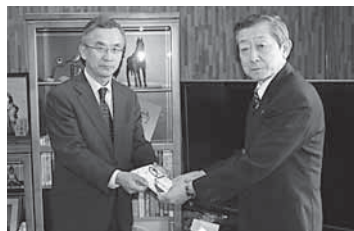
▲(株)間組が白石城大手門見学者通行用スロープを寄付

生活基盤の整備や福祉事業などのため、次の方々からご寄付をいただきました。紙上からお礼申し上げます(敬称略)。