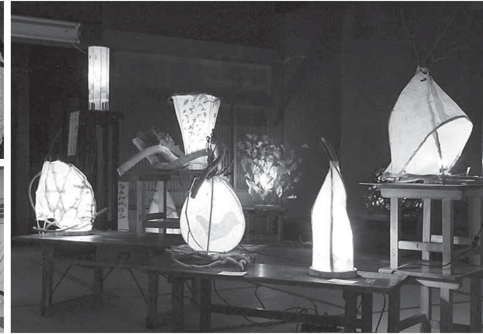
1_思い思いの自由な発想で作品を製作する参加者 2_白石蔵王駅の改札口を入った中2階にある、蔵富人が製作した白石和紙の茶室 3_和紙のやわらかな光は、見る人の心を穏やかにする