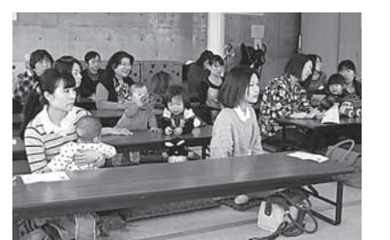
▲発表を聞く参加者の皆さん

などを話し合った後、手遊びや絵本の読み聞かせ、ティーパーティーを行い和やかな雰囲気楽しい時間を過ごしました。