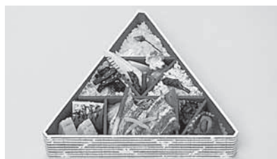
▲「みやぎ蔵王弁当」をご賞味ください

仙南地域自慢の食材を使った駅弁「みやぎ蔵王弁当」の第2弾が、JR仙台駅構内の売店などで販売されます。この弁当は、地元の温泉旅館の女