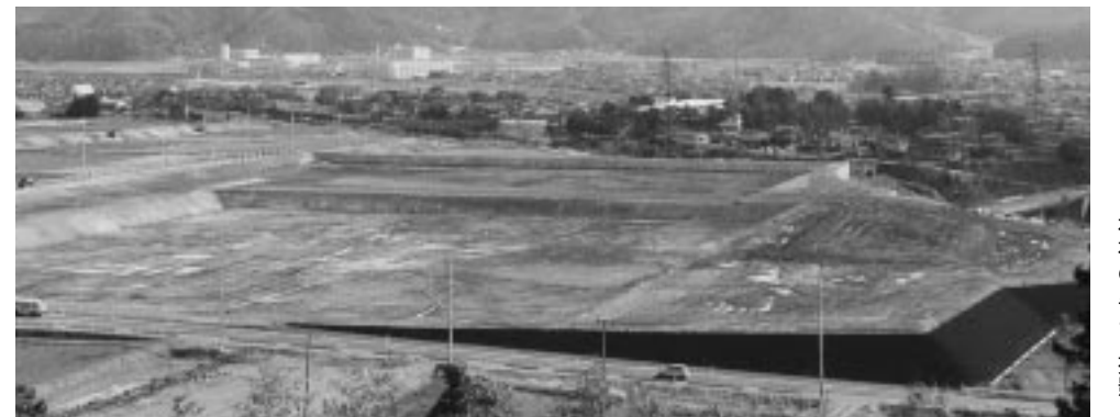
刈田病院移転先（福岡蔵本）の敷地写真

次回は運営システム、情報システムなどについてご紹介いたします。 お問い合わせ先 公立刈田総合病院庶務課 ☎252145