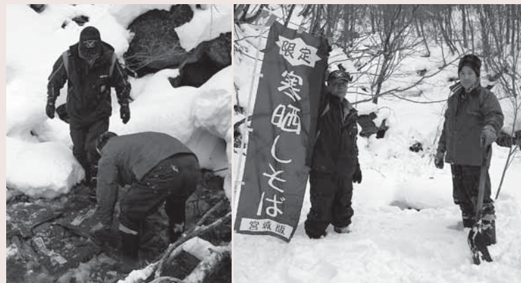
▲気温氷点下2度、水温0度の中、仕込み作業をする参加者の皆さん

大寒の1月20日、恒例の「寒ざらしそば仕込み作業」が南蔵王野営場の上流域で行われました。9年目となる今年の作業には、白石興産(株)の社員やそば店経営者など6人が参加。八宮農業生産組合が育てた玄そば450kg、10俵を立春の2月4日までの約2週間、蔵王の清流に浸しました。冷たい清流に浸すことでそばのアクが抜け、ほのかな甘みとつるりとしたのど越しが楽しめる「寒ざらしそば」。市内では、材木岩公園内の「小原なごみ茶屋」で3月15日(木)から、長寿庵で3月1日(木)から提供される予定です。ぜひご賞味ください。