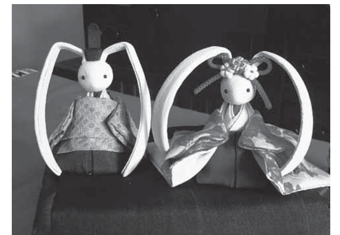
▲昨年の手作りの作品。かわいいうさぎのおひなさまです