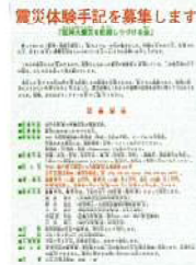
▲チラシ「震災体験手記を募集します」(日本郵政)；神戸大学附属図書館震災文庫蔵