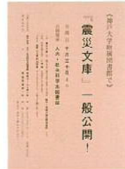
▲ポスター「神戸大学附属図書館で『震災文庫』一般公開！」；神戸大学附属図書館震災文庫蔵