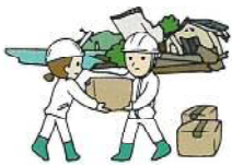
▶資料救済の道具 個人蔵