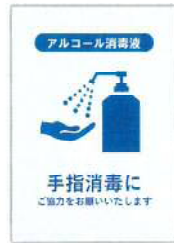
▲B & G プール入口の張り紙