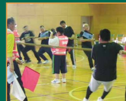
▲福岡レクリンピックでカメラマン!(中央)

7月に行われた福岡地区レクリンピックには、有志の生徒がボランティアとして参加し、記録や写真などの役割を担うとともに、若い力として行事を盛り上げ、参加した方々から感謝の言葉をいただきました。9月に行われた「しろいし蔵王高原マラソン大会」でも、50人以上の生徒がランナーやボランティアとして参加しました。これからは自分たちの地域を自分たちで盛り上げようと活躍する子どもたちを応援していきます。