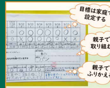
▲家庭で記録した生活カード

者からも「お手伝いを頑張るようになってきました」という感想が聞かれました。また、栄養教諭と連携して年2回の特別授業を行い、子どもたちの「食」への関心を高めています。これらの取り組みが評価され、昨年度、県教育委員会から「ルルブル推進優良活動団体」として表彰されたことは学校全体の励みとなりました。今後も子どもたちが心身ともに健康な生活が送れるよう取り組みを継続していきます。