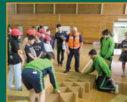
▲防災訓練での段ボールベッド組み立て