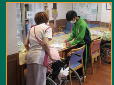
▲積極的に取り組んだ職場体験