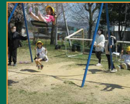
▲休み時間は元気に外遊び