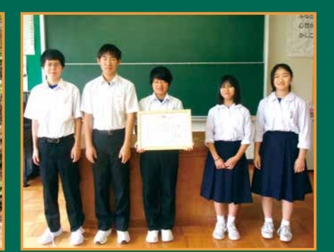
▲賞状を手に記念撮影をする子どもたち