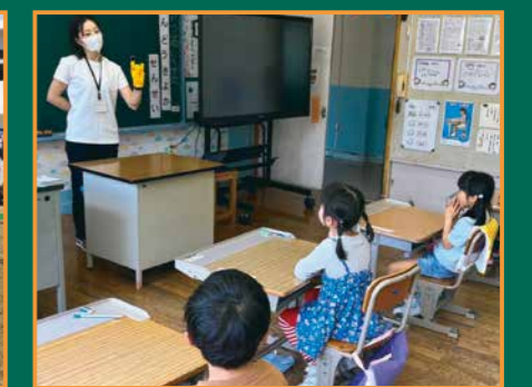
▲園の先生とも交流しています