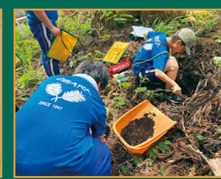
▲身近な地域の土壌調査