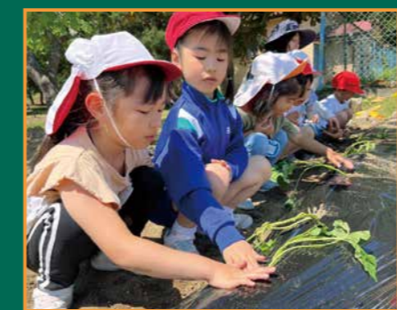
▲優しく土を掛けるんだよ!

していました。収穫後は、一緒にサツマイモ料理 に挑戦する予定です。伝統の「動くジャンボカル タ取り大会」にも園児の皆さんを招待しています。 相手をするのは1・2年生。目を輝かせて追い掛 けてくる園児に対し、少し力を緩めてカルタを取 らせてあげる姿はほほ笑ましいものです。 園児から「小学校が楽しみ」という声が聞かれ た保育園と小学校の連携を、これからも深めてい きます。