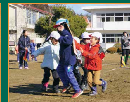
▲伝統行事の「動くジャンボカルタ取り大会」