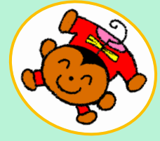
支援センターキャラクター “あいあい”

白石市地域子育て支援センター 〒989-0275 白石市字本町 27 番地 ふれあいプラザ内 E-mail : kosodate@city.shiroishi.miyagi.jp TEL : 22-6025 FAX : 22-6027