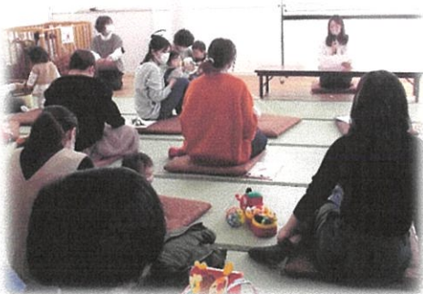
会員の発表を聞く参加者のみなさん

子どもの習い事の付き添いで会う方が仕事の都合で送迎が難しいと聞き、「私で良ければ」とお子さんの送迎を引き受けたのが、両方会員になったきっかけです。