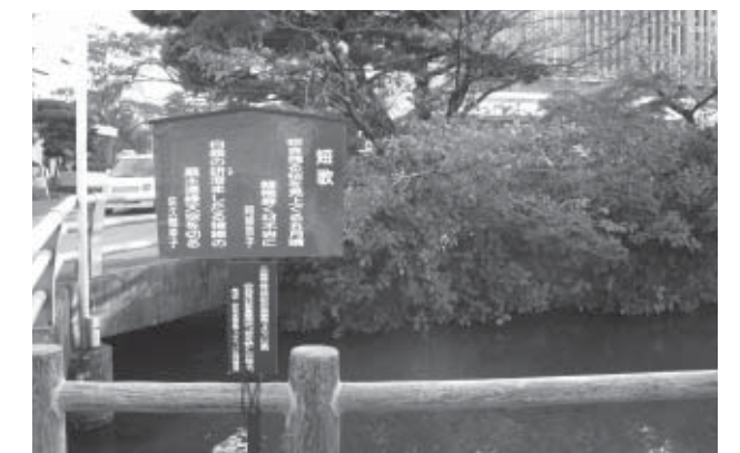
▲全64作品を24カ所に掲示！ 散策しながらご鑑賞ください

◎白石市生涯学習フェスティバル実行委員会事務局 (中央公民館内) ☎22-1343