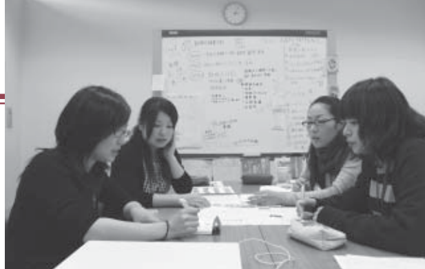
▲「ふるさといきいきだより」編集会議の様子

●白石初のアニメのキャラクターが誕生したそうですね！ 本スタジオは、これまで東京の本社が受託したアニメの制作などを行ってきましたが、現在は、市から受託した観光・地域振興に役立てるためのアニメの制作などを行っています。そして、ようやく、白石初のアニメ「白石の妖精ぴち」のキャラクターが誕生し、これから、本