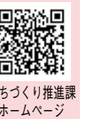
まちづくり推進課 ホームページ