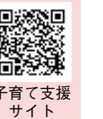
子育て支援 サイト