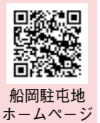
船岡駐屯地 ホームページ