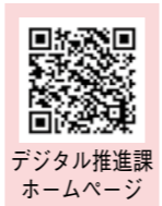
デジタル推進課 ホームページ