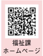
福祉課 ホームページ