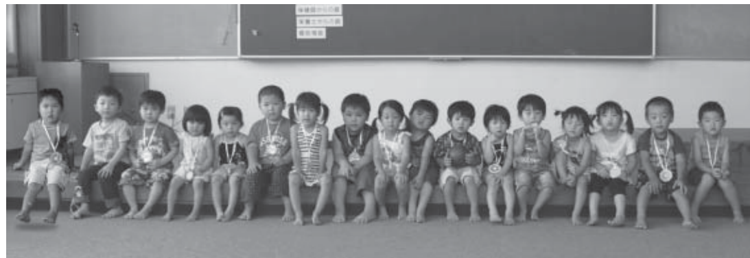
▲7月27日の3歳6カ月児健診を受診した子どもたち