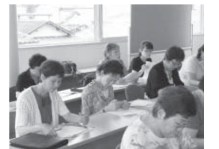
▲熱心に話を聞く参加者

7月6日に開催した講演会では、日常的に起こり得る、子どもの病気の知識と見分け方、受診までの経過観察と対処法、受診時に医師へ伝える症状のポイントなどを学習しました。予防接種の時期や必要性、特にヒブワクチンや肺炎球菌についての質問が多く出され、参加者は最新の情報と正しい知識を確認しました。