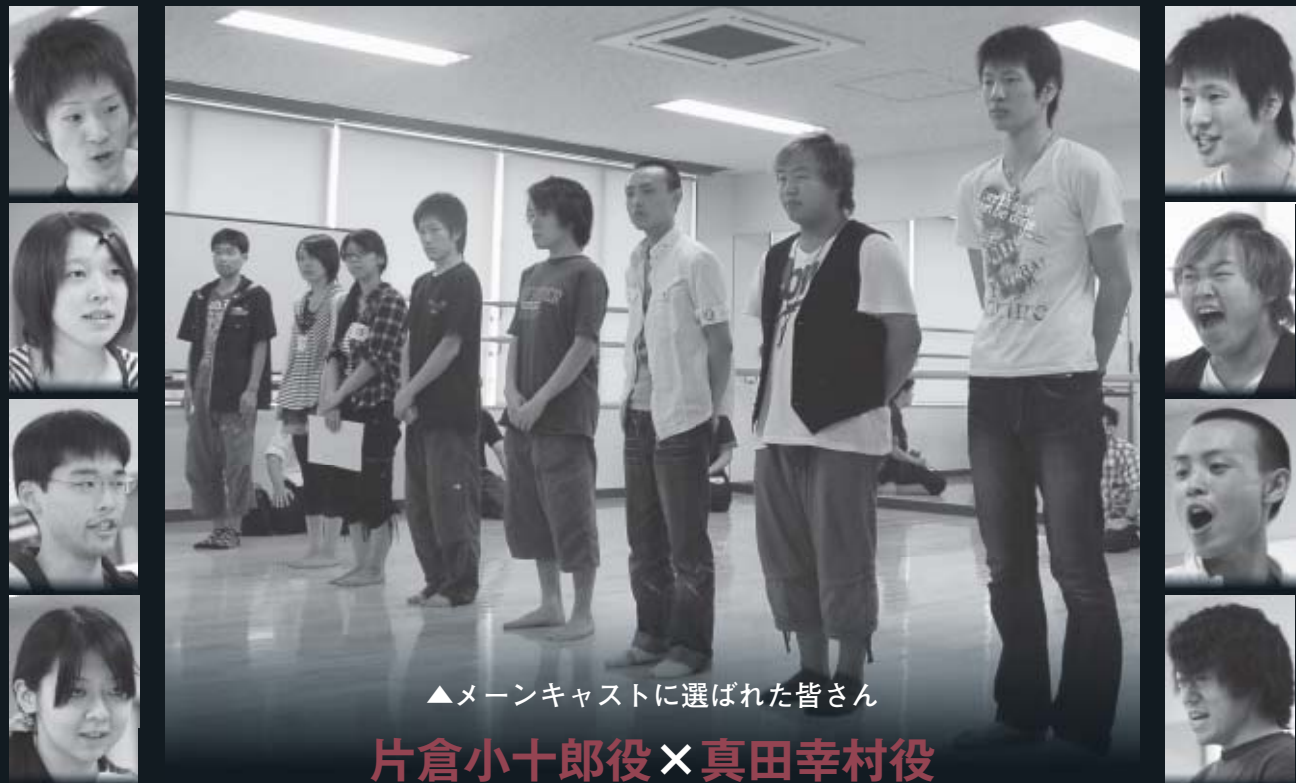
▲メインキャストに選ばれた皆さん

大坂夏の陣における激闘を、約60人の武者による合戦シーンや鉄砲隊による実演などで再現するこのまつり。見どころは、観客の目の前でされる合戦シーンの臨場感。皆さんぜひご覧ください。