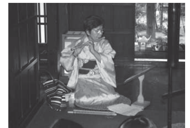
▲昨年度の様子。篠笛の音色が訪れた人々を魅了しました