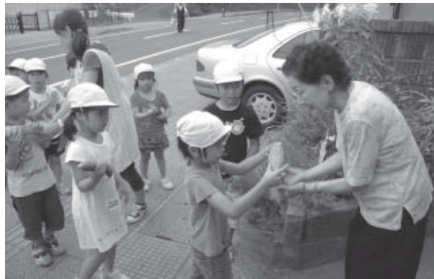
▲収穫したゴーヤをご近所におすそ分け

収穫したゴーヤは、チキンカレーに入れてこの日の給食に。また、ご近所にもおすそ分けし、大地の恵みをみんなでいただきました。