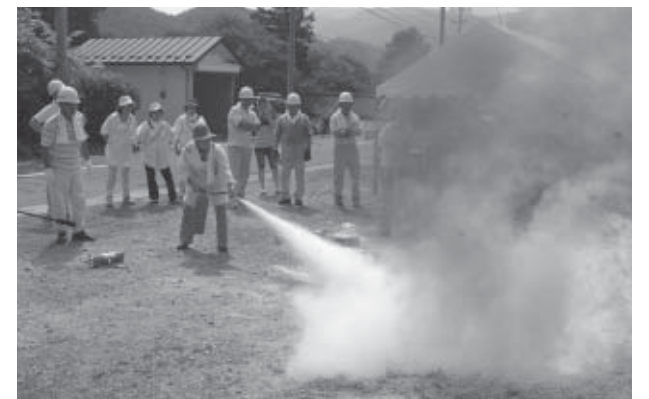
▲婦人防火クラブによる初期消火訓練

8月1日、小原冷水水自治会で自主防災訓練が実施されました。同自治会の自主防災組織は平成19年2月に設立。今回が初めての防災訓練となりました。