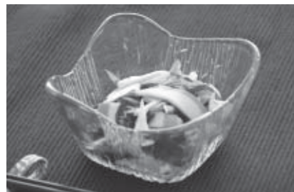
エネルギー 32kcal / たんぱく質 1.9g / 塩分 0.9g