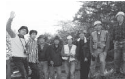
▲和気あいあいと活動しています

会員同士の親睦を図りながら、写真技術の向上と感性を磨くことを目的に活動しています。会員が撮った写真を持ち寄って、先生に見てもらいます。初心者大歓迎! まずは見学にお越しください。