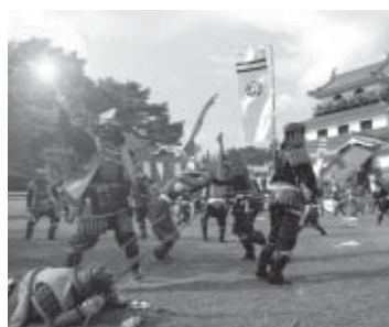
▲第2回鬼小十郎まつりの様子

今年も、春・夏・秋とまつりが開催されます。おのおの独特の雰囲気やストーリーがあり、全国に誇れるまつりであるとともに、自分たちのまつりを自らが作り上げ楽しむために、市民が携わり、参加していることを誇らしく思います。