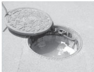
▲マンホールのふたを開けると油が原因で満杯に

せっかく整備された下水道施設であっても、正しく利用しないと、水質悪化の原因になるだけでなく、下水管が詰まったり汚水をくみ上げるポンプが故障したりするなどの原因となります。特に、ご家庭や飲食店などで使用した残り油をそのまま流してしまつと、下水道管内に付着した油が固まって大きくなり、本管が詰まり流れなくなる現象を引き起こします。そうなる前、修理には特殊な機械が必要となります。油は、新聞紙やキッチンペーパーなどにしみ込ませてから「もやせるごみ」とするか、専用の油処理剤を使用して処分しましょう。また、次のことにもご注意ください。