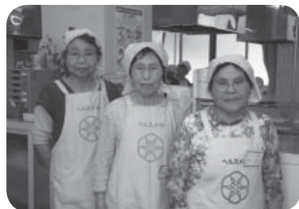
ヘルスメイト白石 大平地区の皆さん