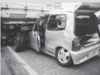
▲一瞬ですべてを失う悲惨な交通事故

本市を含む白石警察署が管轄する地域で、交通死亡事故が相次いで発生しています。6月に七ヶ宿町で3人、7月に本市で1人の尊い命が失われるなど、1月からの7月までの7カ月間で5の方が犠牲となっています。これ以上、尊い命を失う交通事故を発生させてはいけなと、白石警察署では、8月6日から10月5日までの2カ月間に渡り、交通死亡事故抑止「非常事態総力対策」を行います。