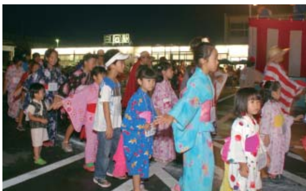
▲浴衣や仮装での盆踊りは大いに盛り上がりました

この日は各地区でも盆踊り大会が開催され、まつりを楽しむとともに地域のきずなを深めていました。