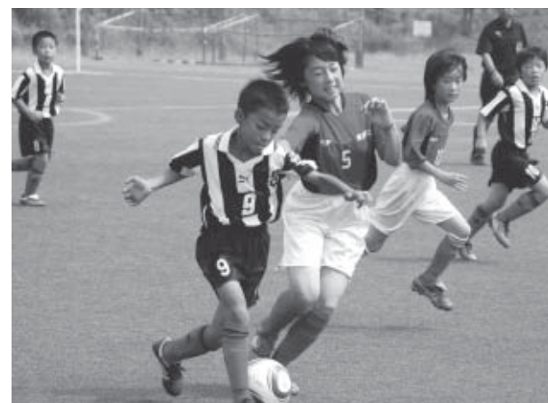
▲1つのボールをひたむきに追いかける両市の子どもたち

大会後の感想では、「友達が増えてうれしかった」「別れるのがつらかった」などの声の子どもたちから聞かれました。2日間という短い期間ではありましたが、交流は楽しく、試合は真剣勝負！子どもたちにとって貴重な夏休みの思い出となりました。