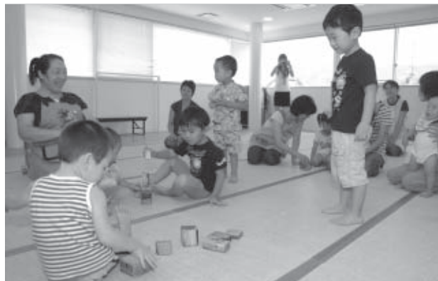
▲8月12日はルンルンるーむの利用者が遊びました

積み木は、子どもたちが口に入れても大丈夫のように無害な塗料を使用。積み木を受け取った子どもたちは、早速、積み木を並べて電車や家を作って木のぬくもりを楽しんでいました。