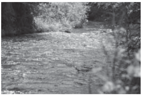
▲下水道施設が白石のきれいな水を守っています