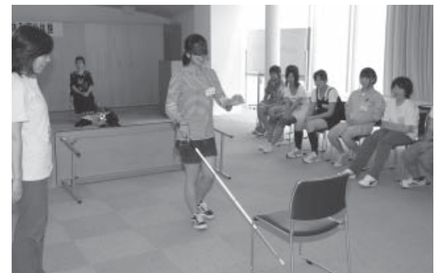
▲目隠しをしての歩行体験

8月3日、市内の福祉施設などを利用し、子どもたちに福祉の現場を体験してもらおうと、「夏休み福祉体験」(白石市社会福祉協議会主催)が開催されました。