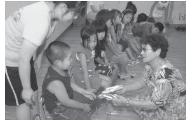
▲世界にひとつだけの布草履をいただきました

「まんさく」の皆さんは、「子どもたちの健康な足形(足裏)維持に役立ててほしい」「昔の履物を知ってほしい」という思いを込めて布草履を贈りました。園児たちは早速、その履き心地を体験し大はしゃぎ。最後に、みんなで盆踊りの曲に合わせて、夏祭り気分を楽しみました。