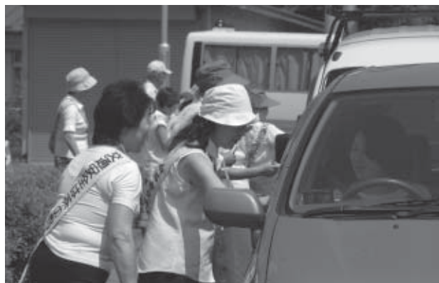
▲炎天下でも、笑顔で交通安全の願いを伝える参加者

8月6日、毎年恒例となった夏の交通安全「ひと休み運動」街頭キャンペーンが、情報センター「アテネ」駐車場で行われました。