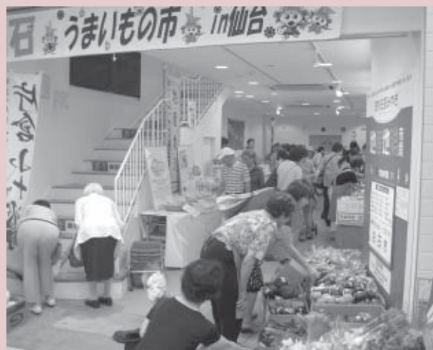
▲店内は予想以上の盛況でした

※9月19日(日)の「みやぎ蔵王高原マラソン」(南蔵王野営場)には、パーバ工愛市が出店します。