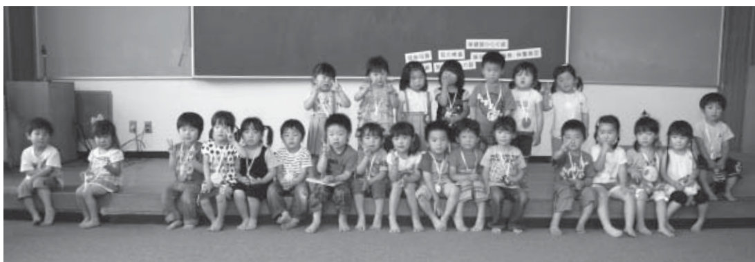
▲6月15日の3歳6カ月児健診を受診した子どもたち