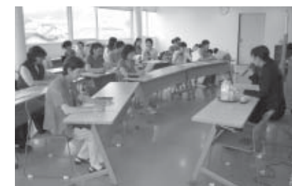
▲熱心に話を聞く参加者

方からは「援助活動のときのアドバイスなどに生かしたい」などの感想が聞かれました。