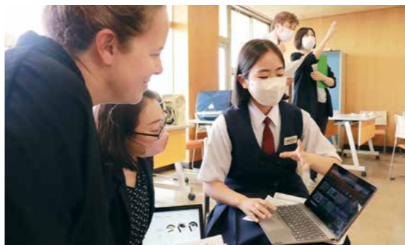
▲訪問団は、派遣にあたり4回の事前研修を行います。ALTなどの協力のもと、英会話を学ぶ語学演習やラファエル校で披露する発表などの準備を行いました

市長 日本とは違った景色やオーストラリアでしか体験できないことがそれぞれあったと思います。