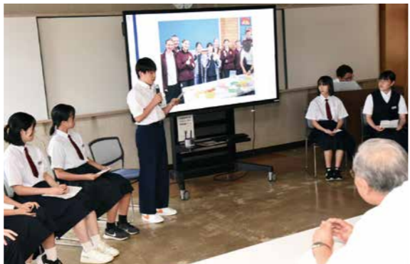
▲帰国後に報告会を行い、それぞれが学校体験やホームステイなどについて発表しました

市長 皆さんのオーストラリアでの経験は、人生の大きな財産です。現地で感じたことや学んだことを