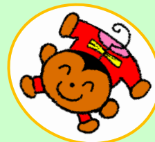
支援センターキャラクター "あいあい"

白石市地域子育て支援センター 989-0275 白石市字本町 27 番地 ふれあいプラザ内 E-mail : kosodate@city.shiroishi.miyagi.jp TEL : 22-6025 FAX : 22-6027