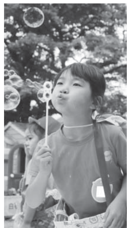
みんなの輪をつなげよう! 広げよう!

安心して子どもを産み、子どもたちが健やかに成長できるまち白石を目指して 白石市次世代育成支援行動計画(後期)を策定! 子ども・親・地域 みんなが育ちあうまちづくり 「白石市次世代育成支援行動計画(後期)」は、白石市役所1階子ども家庭課で閲覧できます。また、白石市ホームページにも掲載していますので、ぜひご覧ください。 子ども家庭課 ☎22-1363