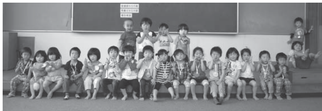
▲5月25日の3歳6カ月児健診を受診した子どもたち