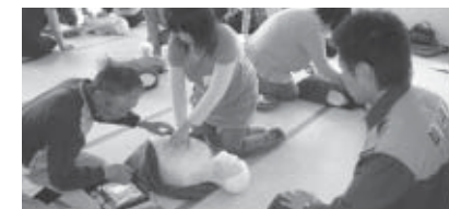
▲熱心な指導が行われました