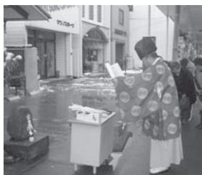
▲中心市街地の活性化を祈願