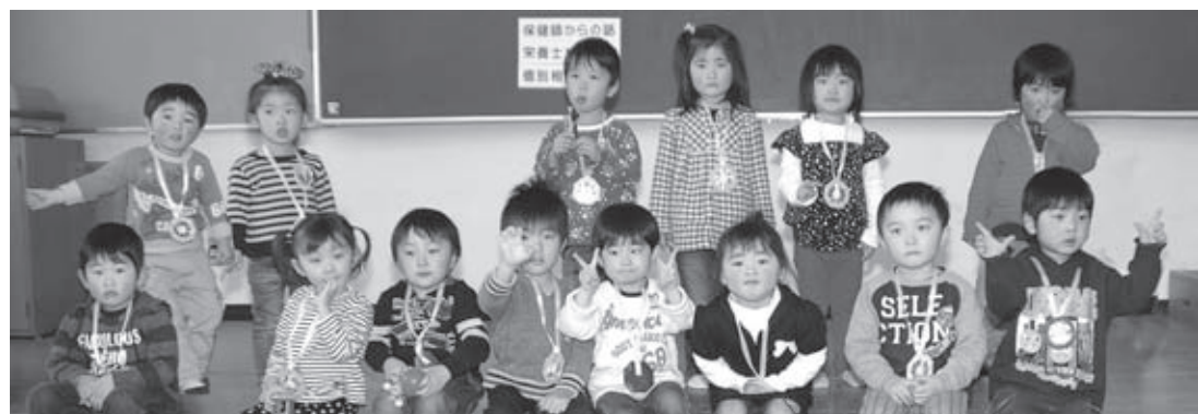
▲3月23日の3歳6カ月児健診を受診した子どもたち