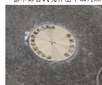
都市部官民境界基本三角点

都市部官民境界基本三角点、都市部官民境界基本多角点、都市部官民境界基本細部点が該当します。