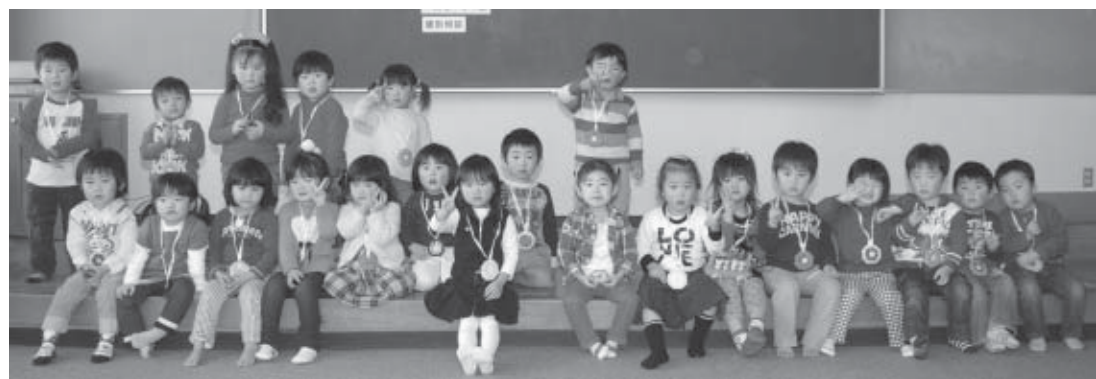
▲2月23日の3歳6カ月児健診を受診した子どもたち