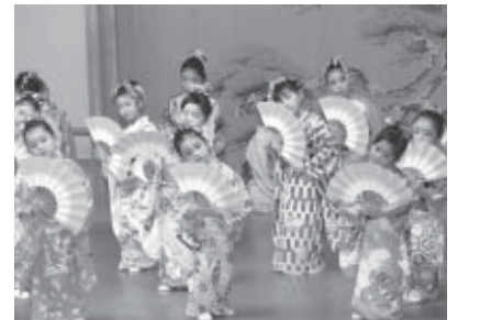
▲子ども日本舞踊講座の発表

3月13日、白石市伝統芸能振興会が主催する「伝えよう 郷土の伝統芸能鑑賞会」が開催されました。