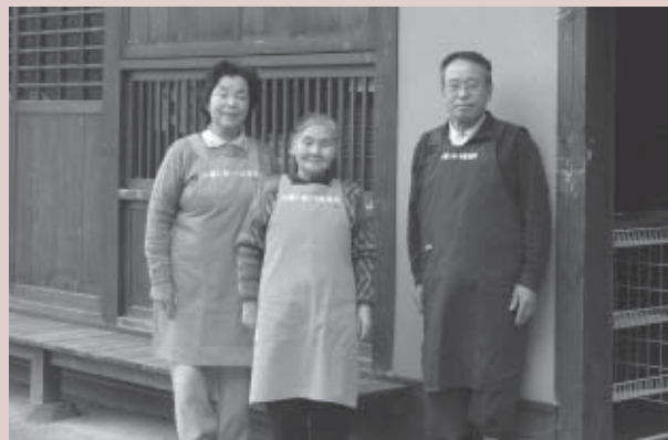
▲小原いきいき直売所の皆さん

また、直売所隣の「手打ちそば処小原なごみ茶屋」では、期間限定の「寒ざらしそば」が食べられます。約2