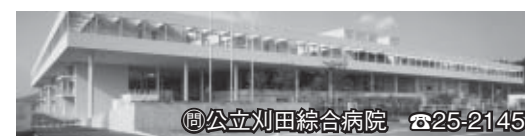
◎公立刈田総合病院 ☎25-2145