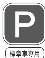
▲この標識が目印(実際は青色)