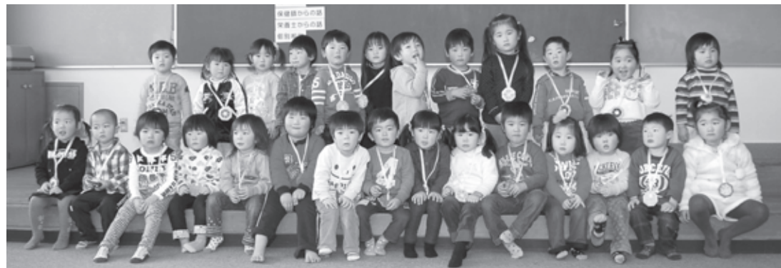
▲1月26日の3歳6カ月児健診を受診した子どもたち