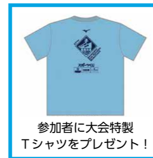
参加者に大会特製Tシャツをプレゼント！