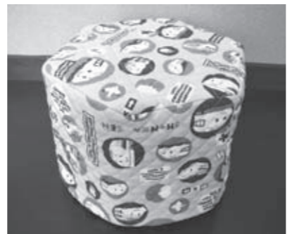
▲牛乳パックの六角ツール