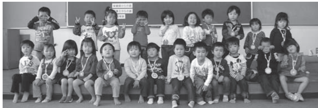
▲10月20日の3歳6カ月児健診を受診した子どもたち