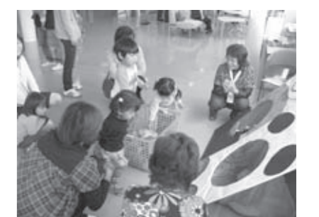
▲手作りおもちゃで楽しく遊ぶ親子

やボウリング、玉入れなどで楽しく遊んだりして、スタンプ台をシールでいっぱいになりました。