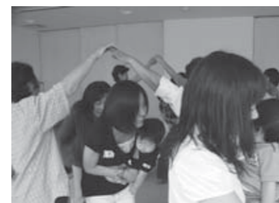
▲参加者の皆さんで楽しく遊びました

9月9日、子どもの発達に応じた遊びや手作りおもちゃ製作、わらべうた遊びの実践を通して、参加者同士が交流しながら子どもの心の成長について学習しました。