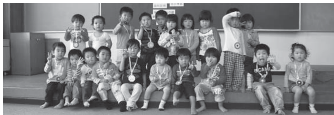
▲9月15日の3歳6カ月児健診を受診した子どもたち