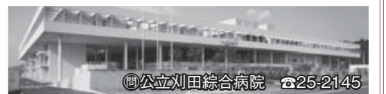
☎公立刈田総合病院 ☎25-2145