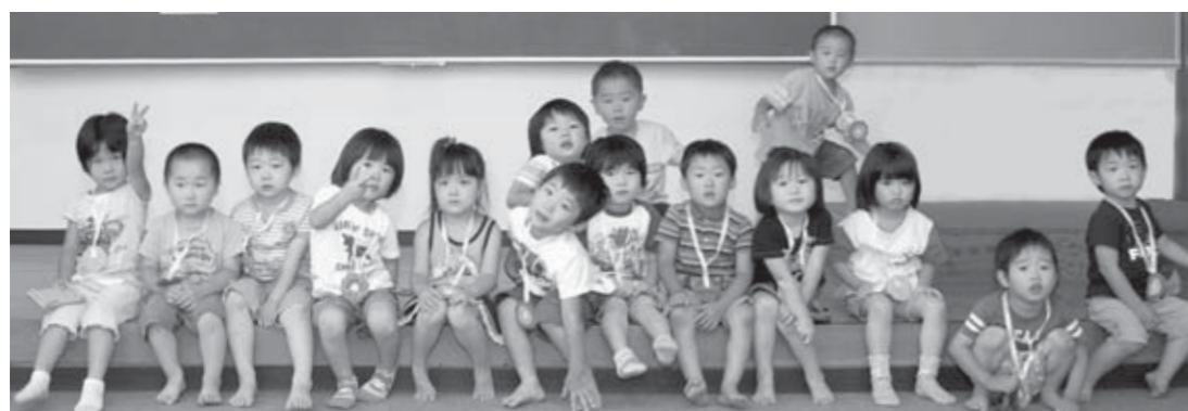
▲8月25日の3歳6カ月児健診を受診した子どもたち