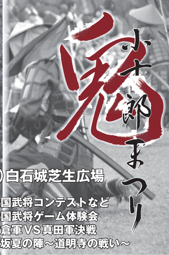
▲7月25日の練習会で合戦シーンを演じる 参加者の皆さん