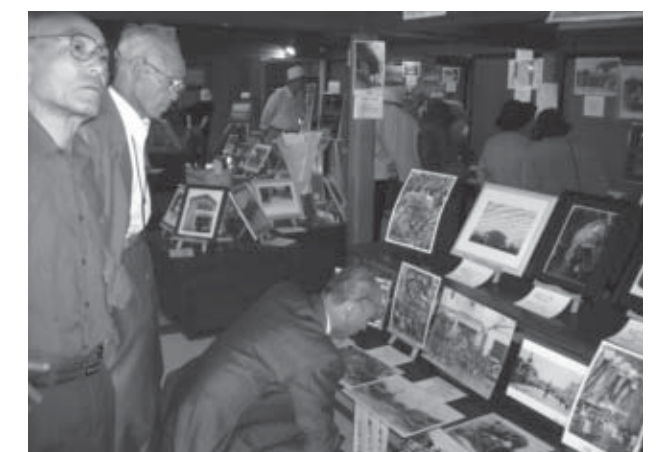
▲昨年の写真展の様子