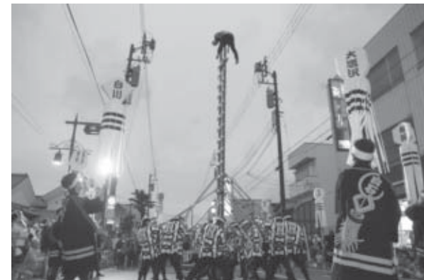
▲白石夏まつり恒例の白石市消防団階子乗り隊による伝統はしご乗りの演技。白石の夏まつりは、消防団の皆さんによる伝統はしご乗りの演技から始まります。