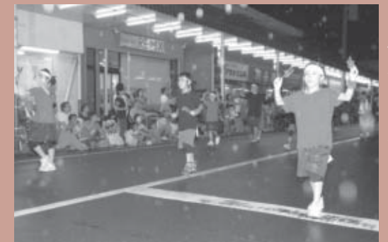
■準優勝 アルバルクキッズ