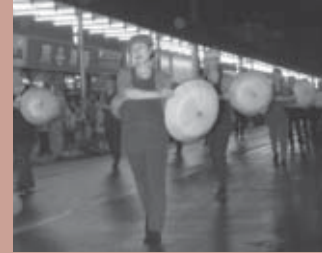
■ユーモア賞 いっちょやったる会