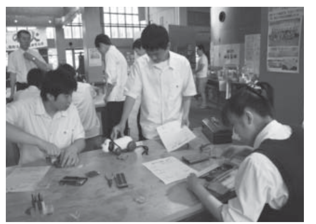
▲壊れたおもちゃを直す白石工業高校の生徒たち

「治療中」は心配そうに見つめていた子どもたちも、「元氣」になったおもちゃを受け取ると、とてもうれしそうな表情を見せていました。