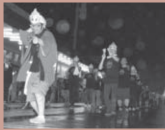
■第三位 公立刈田総合病院