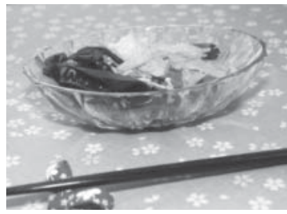
エネルギー29kcal / たんぱく質0.5g / 塩分0.9g