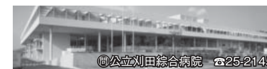
☎公立刈田総合病院 ☎25-2145