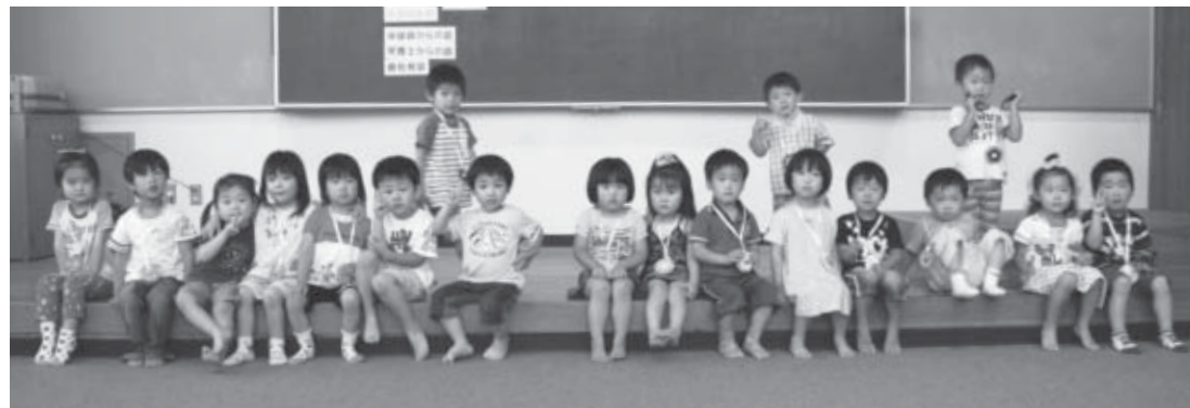
▲7月21日の3歳6カ月児健診を受診した子どもたち