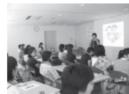
▲真剣に話を聞く参加者

映像や統計を通して命の大切さや若者の性の現状を知ることにより、子どもを守ることの必要性和子どもへどう伝えていくかを学びました。日常生活での子どもの行動や、性に関する具体的な伝え方について質問が多く出され、皆さんの関心の高さを感ずることができました。