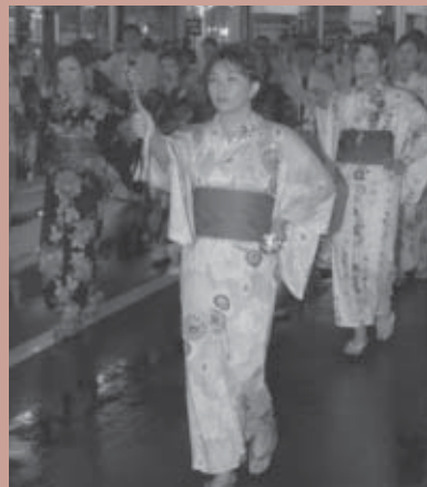
■アイデア賞 東北電力企業グループ