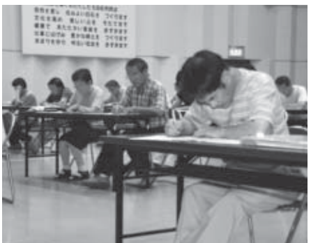
▲職員提案により開催されたSHIROISHIマイスター「白石ものしり博士」検定試験の様子(7月26日)

●ホームページアドレス http://www.city.shiroishi.miyagi.jp/section/gyoukaku/shuchu/ 集中改革プランに関する問い合わせ先：行政改革推進室 ☎22-1561