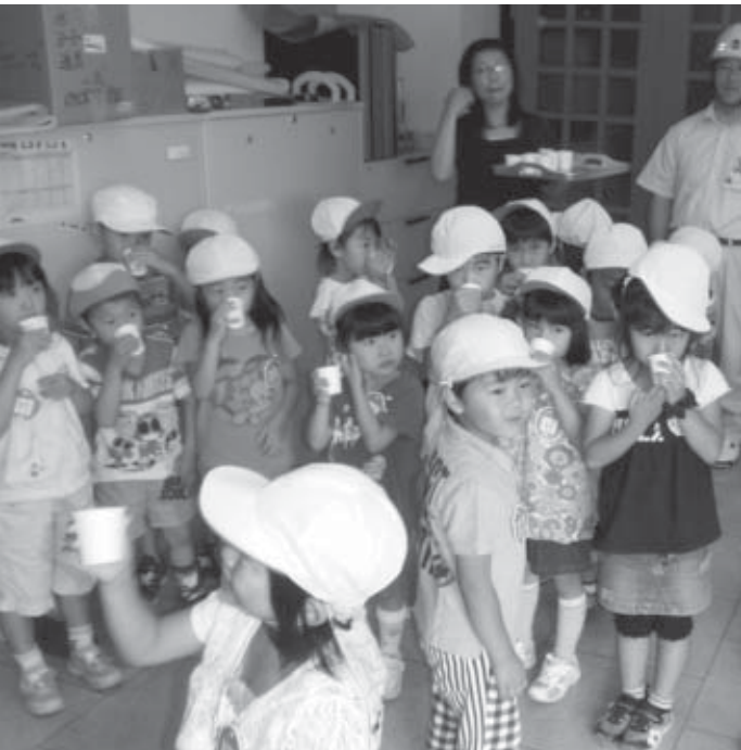
▲上下水道事業所の見学の後、白石のおいしい水を飲む西保育園の園児たち