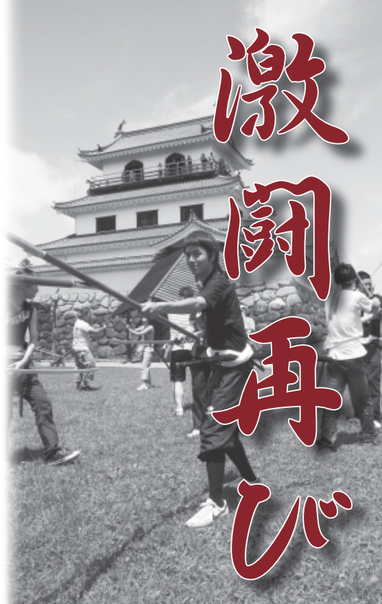
▲7月25日の練習会で合戦シーンを演じる参加者の皆さん