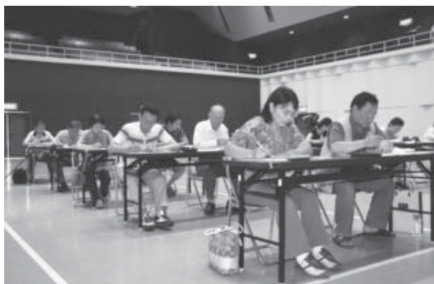
▲真剣な面持ちで問題に取り組む受験者の皆さん

中央公民館で7月26日、SHIROISHIマイスター「白石ものしり博士」検定試験を開催しました。