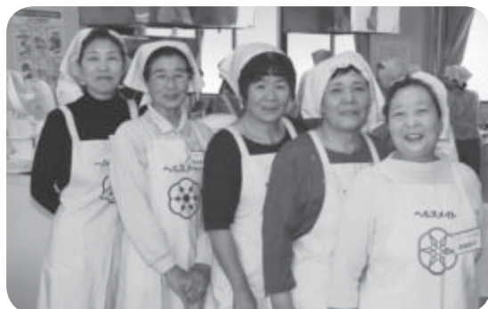
ヘルスメイト白石