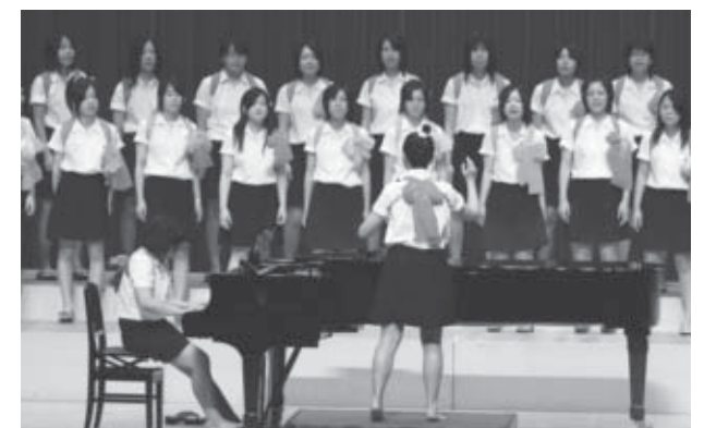
▲グランプリを獲得した3年4組の合唱の様子

審査の結果、四国地方のわらべ歌「四国ばやし」を自由曲とした3年4組がグランプリを獲得し、体育祭に続いて2つのタイトルを手に入れました。