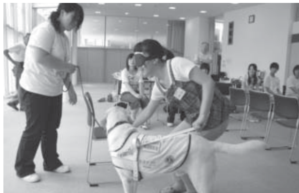
▲目隠しをして盲導犬との歩行を体験する生徒

8月6日、市内の福祉施設などで「夏・福祉体験ワークキャンプ」が開催され、市内の中高校生7人が参加しました。このワークキャンプは、福祉現場での体験を通して社会福祉への関心を高めてもらおうと、白石市社会福祉協議会が平成6年から開催しています。参加者は、障害者とのふれあい体験や盲導犬と視覚障害に関する学習体験などを通して、ボランティア活動の大変さや大切さ、やりがいを学んでいました。参加した生徒からは「このキャンプに参加する前と後では、ボランティア活動への意識が大きく変わりました」などの声が聞かれました。