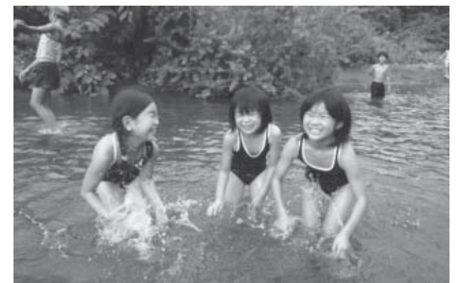
▲大自然の中で大喜びで遊ぶ子どもたち！

7月28日、第二児童館が主催する「夏のレクリエーション」を、蔵王町の宮城県蔵王自然の家で行いました。