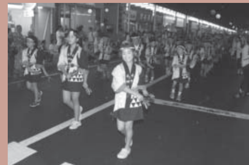
■第三位 本郷第三地区子供会