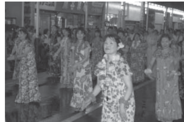
▲3年連続で大人の部優勝の「医療法人社団蔵王会 仙南サナトリウム」の皆さんのパレード。今年は、手作りの「ムーム」で参加しました。

審査の結果、子どもの部では「白石市古典芸能伝承の館 碧水園」が優勝、大人の部では「医療法人社団蔵王会 仙南サナトリウム」が3年連続で優勝しました。