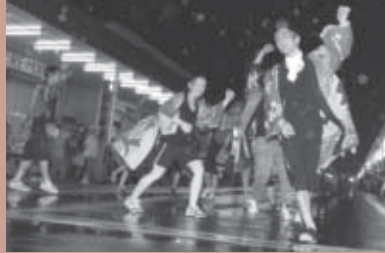
■ハッスル賞 飛丑寅