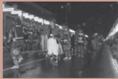
■準優勝 ソニー白石セミコンダクタ株式会社