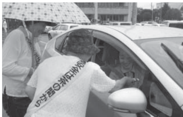
▲飲み物やチラシを配り安全運転を呼び掛ける会員

雨の中での開催となった今年は、交通安全協会などの会員約50人が参加しました。冷たい飲み物やチラシなどを配り安全運転を呼び掛ける参加者に、ドライバーも笑顔で答えていました。