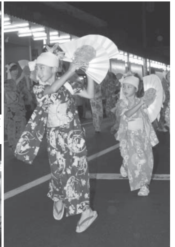
▲子どもの部優勝の白石市古典芸能伝承の館 碧水園

白石の夏の風物詩、白石夏まつり「白石音頭パレード」が8月11日、市内中心部で開催され、約26,000人の見物客でにぎわいました。