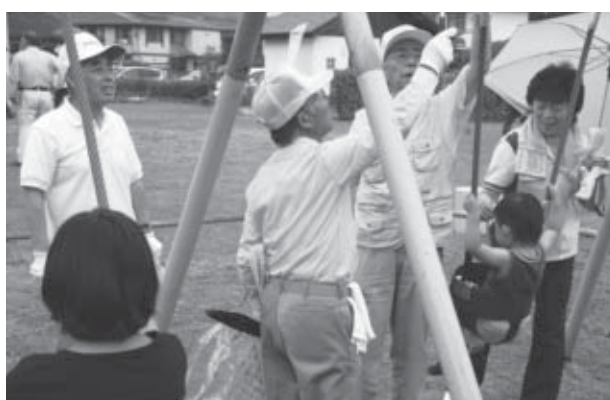
▲真剣な表情でつくし公園のブランコを点検する参加者

7月18日、市内の公園に設置されている滑り台やブランコなどの遊具を一斉に点検する「市内公園等遊具一斉点検」を実施しました。この一斉点検は、大人の目線で遊具の安全性に関心を持っていただくことを目的に実施し、当日はあいにくの雨にもかかわらず、母親クラブや各公園の愛護団体、子ども会育成会連合会などから約80人が参加し、9つの班に分かれて市内28カ所の公園の遊具を点検しました。