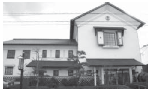
▲4月から水道事業と下水道事業を「上下水道事業所」として統合しました。

今月号では、平成20年度までに実施した集中改革プランの概要と取り組み状況をお知らせします。市民の皆さまのご理解とご協力をお願いします。