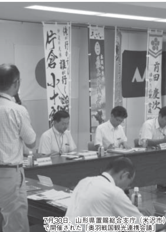
7月30日、山形県置賜総合支庁(米沢市)で開催された「奥羽戦国観光連携会議」

このほか、市民の皆さんにご 参加、ご協力をいただくイベン トや事業を多数開催します。