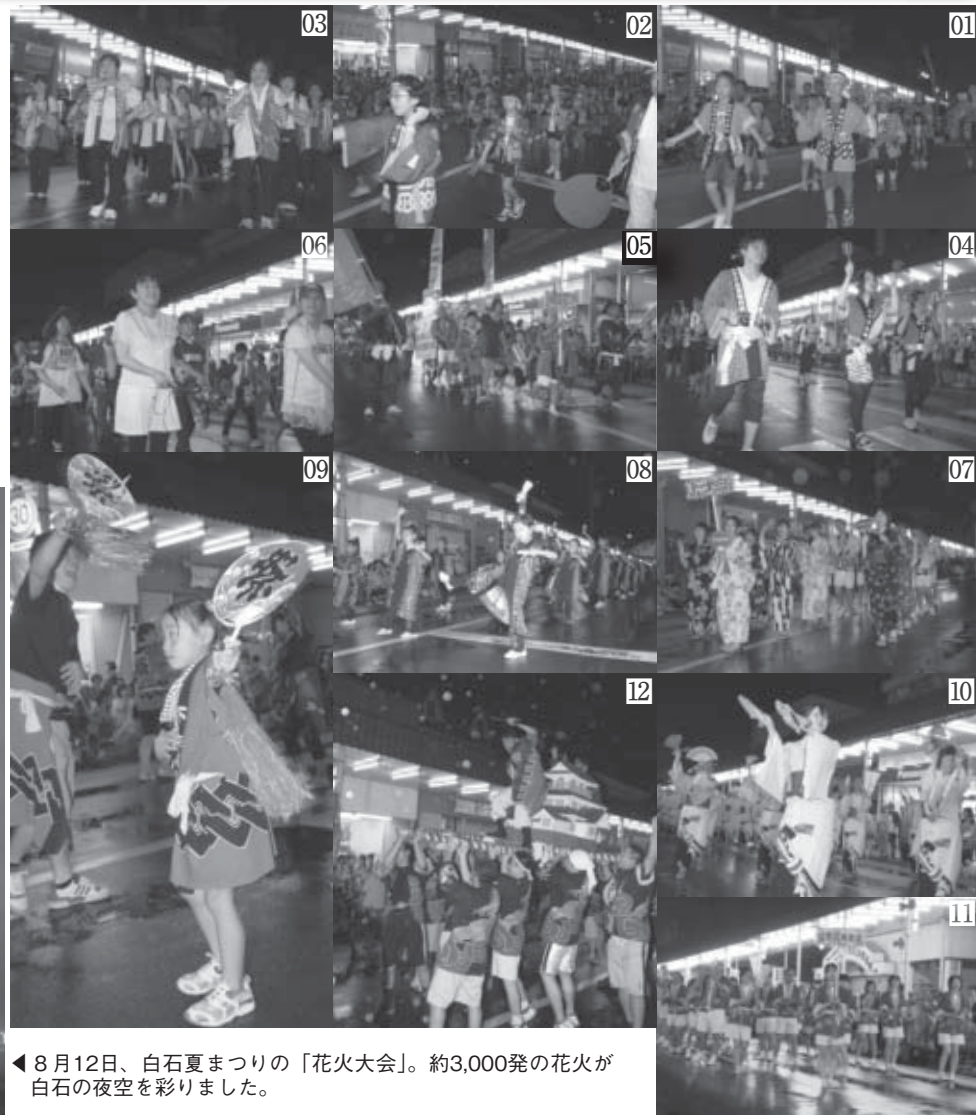
▲8月12日、白石夏まつりの「花火大会」。約3,000発の花火が白石の夜空を彩りました。