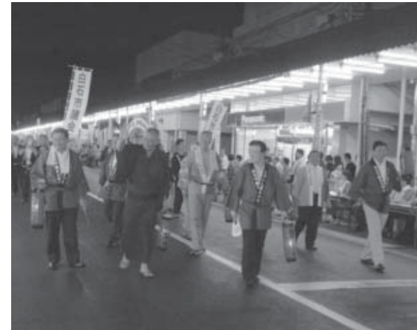
▲パレードの先頭は、白石区ふるさと会の皆さんと風間市長