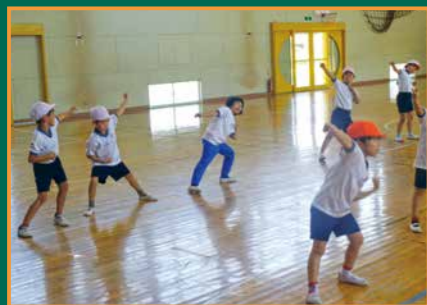
▲準備体操でやっぺえ体操を踊る児童

昨年末、放送局より放映決定の連絡が入り、そのことを全校児童に伝えると歓声があがりました。放映が待ち遠しくてたまりません。冬休みも児童は、保健環境委員会の呼び掛けでダンスによる体力づくりを行っています。先日は、やっぺえが「こじゅうろうキッズランド」に来場したと聞きました。みなさんも大鷹沢小学校の児童たちと「やっぺえ体操」を踊ってみませんか?