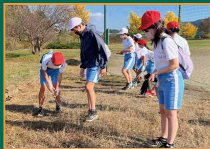
▲緑地公園清掃活動の様子

福岡小の子どもたちがこれからも感謝の気持ちを持ち、自分や友だちを大切にできる心が高まるよう、今後も「かかわり」を視点とした活動を推進していきます。