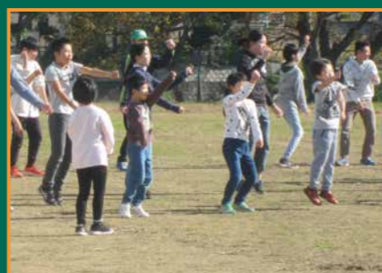
▲休み時間もみんなで踊りを練習!