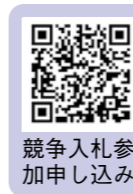
競争入札参加申し込み