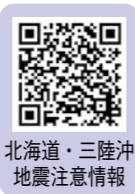
北海道・三陸沖地震注意情報

発表された際には、日頃からの地震への備えを再確認しましょう。詳しくはホームページをご覧ください。