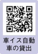
車イス自動車の貸出