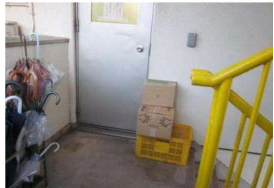
写真1：屋外階段周辺に置かれた障害物