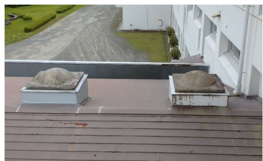
写真1：1階屋根のトップライト