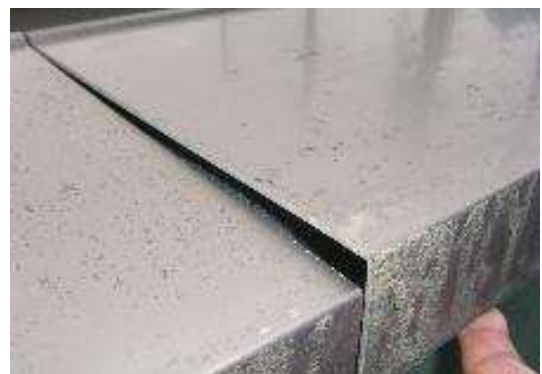
写真1：ぐらつき, 隙間が見られる笠木