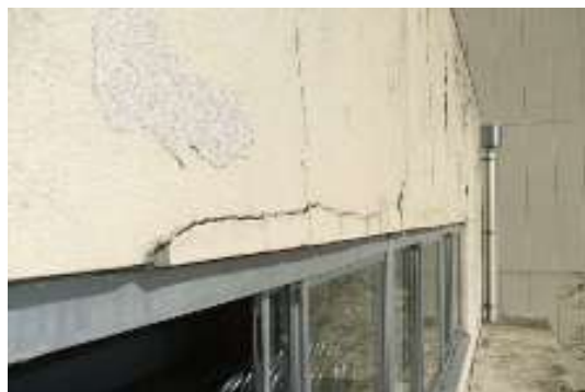
写真1：外壁材の浮き