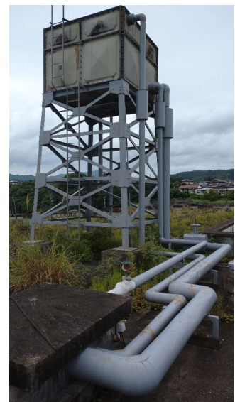
写真1：屋上の高架水槽

建物や各所に上水を供給するため，水道本管から引き込んだ水を一時貯水しておくタンク。屋上に設置して受水槽から揚水された水を貯水し，重力を利用し各所に配水する。