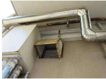
写真1：高所にある配管

手が届く範囲で対応可能なものはすぐに直しましょう。対応できるまでに時間が掛かる場合は、カラーコーンなどで近寄れないようにし、教育委員会に報告しましょう。