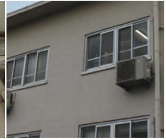
写真2：エアコンの室外機