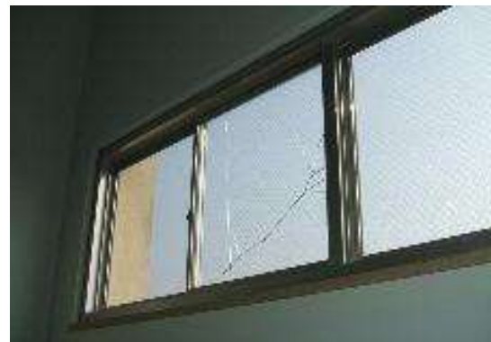
写真1：ひびが入ったガラス

ガラスが割れている場合は、ガムテープ等で止めるか、ダンボールなどで覆うなどして落下を防ぎ、早めに交換しましょう。