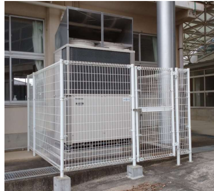
写真1：ガスエアコンの室外空調機

※室外機ではガス空調はガスエンジン，電気空調は電気モーターの働きで冷媒を圧縮しています。