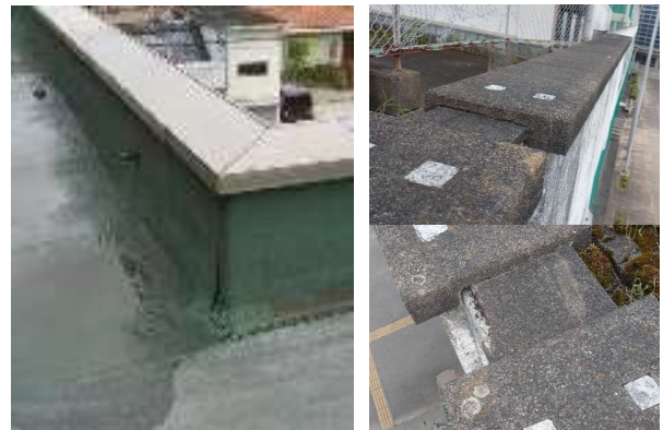
写真1：パラペット 写真2：コンクリート製

建物の屋上やバルコニーの外周部の先端に設けられた低い立ち上がり部分の壁。屋根防水の納まり上, 重要な役割をもっています。