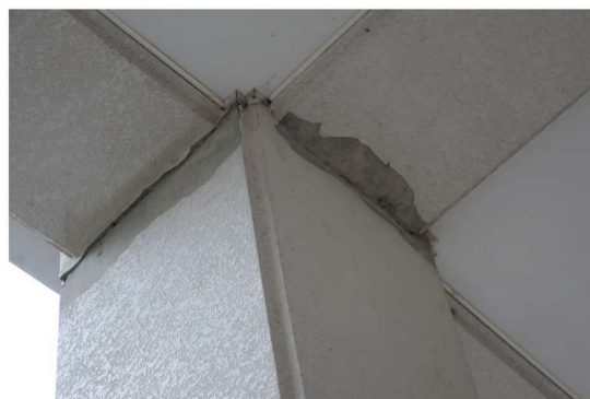
写真1：柱頭部のひび割れ

日常の経過観察や記録を残しておくことで、状況の変化に対応できるようにしておくとともに、危険な箇所が見つかった場合は、カラーコーンなどで近寄れないようにし、教育委員会に報告しましょう。