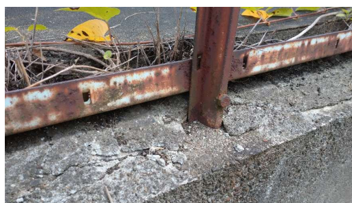
写真1：金属製フェンスの取り付け部分