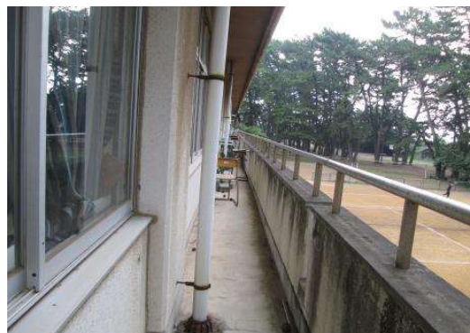
写真1：テラスに出っぱなしの備品