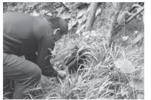
▲疲れた体を癒やすいっぺい清水

途中「いっぺい清水」と呼ばれる地下水があり、ここで水筒に水をくんで休憩する人も多い。