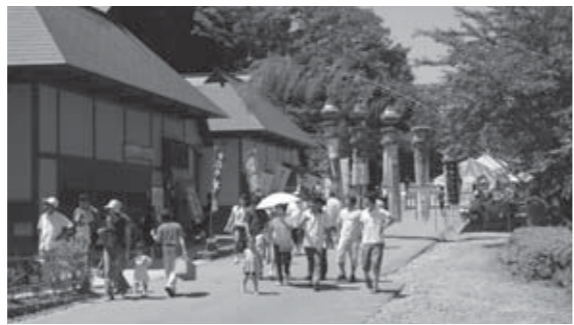
▲晴れた日の休日には多くの方が訪れます。

白石の夏の定番。白石の夏の遊び場としてこの場所ははずせない「材木岩公園」。公園内の親水路で水遊びをする子どもたちの光景がよく見られます。国の天然記念物に指定されている「材木岩」。高さ65m、幅100mにわたって巨大な材木が並べられたようにそびえたつ様子は、何度見ても自然の力強さを感じます。