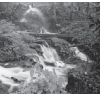
▲神社の周りを流れる清流