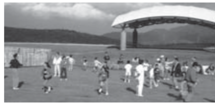
▲野営場内の「未来の森」で遊ぶ家族

蔵王国定公園内にある南蔵王野営場では、普段の生活ではなかなか経験できない貴重な体験ができます。自然と触れることは、子どもたちを成長させる大きな機会です。天気が良ければ最高の星空を見ることが出来ます。この夏、ぜひ利用してはいかがでしょうか？