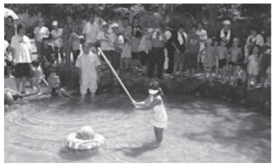
▲夏の検断屋敷まつり恒例の水中スイカ割り大会

そのほか、旧上戸沢検断屋敷を移築復元した建物や、明治時代の小原地区の養蚕・製糸産業を支えた「氷室」を見学するこ