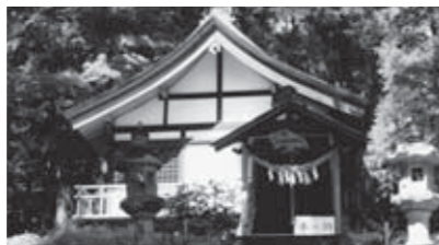
▲朱色の鳥居の先にある神社

野営場へ向かう途中、三住交差点そばにひっそりとたたずむ出雲神社。神社の周りを小川が取り囲み、聞こえるのは水音だけという、神聖な雰囲気と時を忘れさせる空間がここにあります。野営場の帰りにぜひお立ち寄りください。場所が分からないうきは、交差点そば佐藤商店の文房さんを訪ねてみてください。