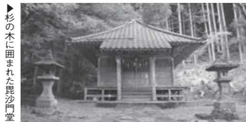
▲杉の木に囲まれた毘沙門堂

建立から350年以上となる毘沙門堂が登山入り口のそばにあります。春はサクラ、秋にはモミジとイチョウの紅葉が楽しめる隠れスポットです。ここに車を止めてケヤキを目指す人も。また、入り口には山から流れる地下水があり、近くの家ではこの水を利用して使っています。