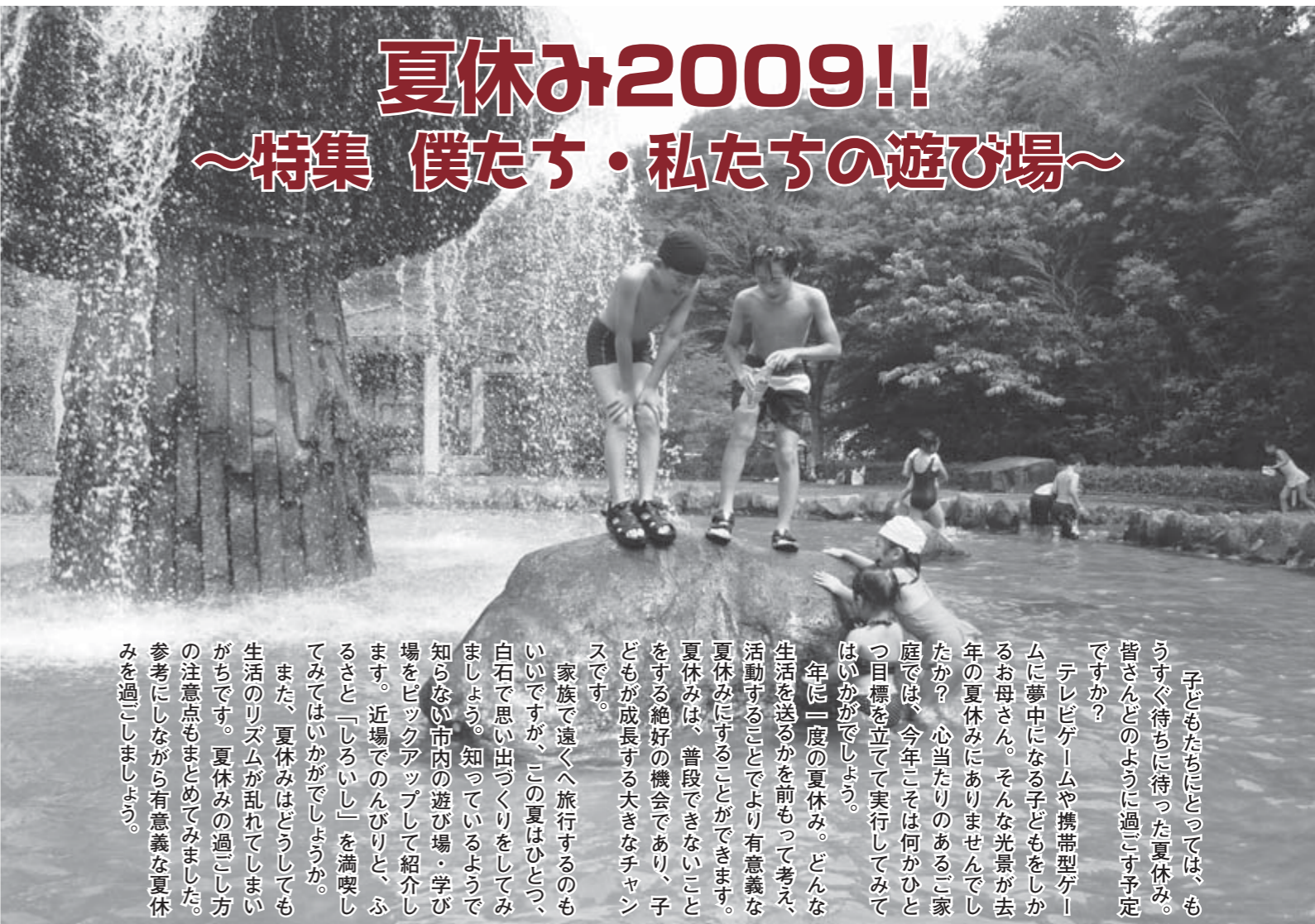
▲材木岩公園で水遊びに夢中の子どもたち

■白石夏まつり開催! パレード参加団体募集中! 今年も開催する「白石音頭パレード」に参加する企業・団体を募集しています。日ごろの活動などをアピールする場として、夏の思い出づくりに一緒に白石の夏を盛り上げましょう! ● 日時 8月11日(火)19時~ ● 白石第一小から白石駅前まで ● 募集締め切り日 7月8日(水) ● 申し込み・問い合わせ先 白石夏まつり実行委員会事務局 (白石商工会議所内) ☎26-2191