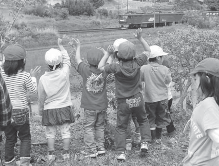
▲公園から見えた電車に子どもたちは大はしゃぎ

また、この場所は線路沿いの公園というところもあり、絶好の鉄道写真のポイントでもあります。家族でお弁当を広げながら、のんびりと過ごしてみたいかがでしょう。