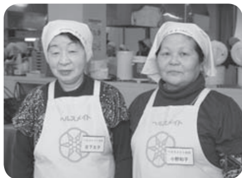
ヘルスメイト白石