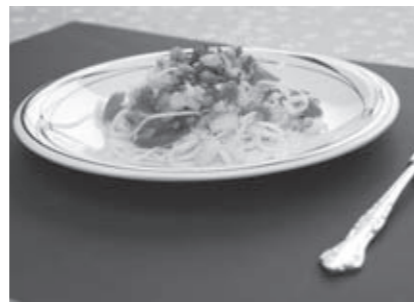
エネルギー258kcal / たんぱく質19.4g / 塩分0.7g