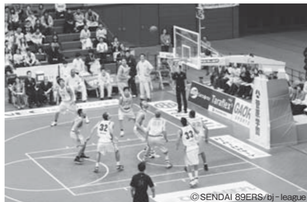
▲迫力あるプレーを間近で体感!