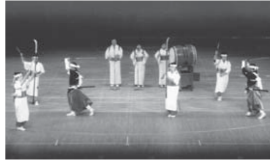
▲「第6回団七踊りとともに」での演舞

全国に誇れる白石の宝であるこの踊りを体験してみませんか?皆さんの参加をお待ちしています。