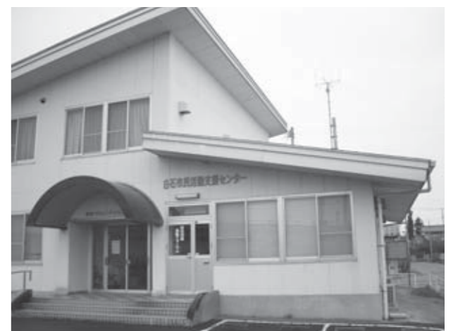
▲城東コミュニティセンターに併設されています。